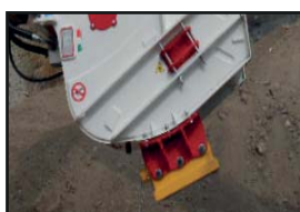
Magnet-Kit + Schalttafel