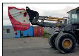
für Radlader / Teleskoplader